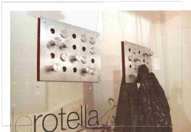
Appendino Attaccapanni in alluminio. Clothes-hanger in aluminium.