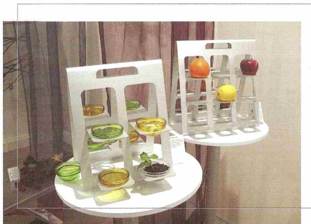
Fruittiera Espositore ricavato da un foglio di acciaio inox tagliato al laser e curvato. Object made from a sheet of stainless steel cut with a laser and bent.